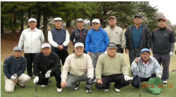
第28回 多賀いちょう会春季ゴルフコンペ (於 相武カントリー倶楽部)