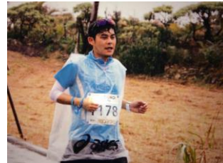
走っている筆者 (今年はいにくの雨でした)

たっぷり盛り上がり翌日はマラソン。厳しいコースですが島民総出の沿道からの応援は笑顔に溢れています。そして走り終わった後の完走パーティ。ウェルカムパーティも盛り上がりませんが、更に盛り上がり美味しいお酒を飲んでみんなで踊る。この完走パーティこそヨロンマラソンの楽しさの象徴だと思います。