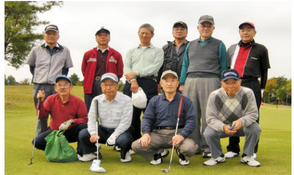
第29回 多賀いちょう会秋季ゴルフコンペ (於 取手桜が丘ゴルフクラブ)