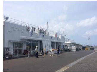
与論空港でのお迎え

す。空港や港では町役場や観光協会の方が総出で迎えてくれて、まずここで温かさを感じ、2回目以降の参加者は皆思わず「ただいま！」と言わずにはいれなくなります。そして、大会前日に開かれるウェルカムパーティ。町の体育館で開催されるのですが、軽食と飲み物を提供していただいて、当然のように与論島の島焼酎である「有泉」も振る舞われ島独自のおもてなしの飲み方(与論献奉といいます)で本当に明日マラソンをするのか？と言いたくなるほど盛り上がります。