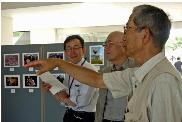
(「こうがく祭」展示風景)

6月1日に工学部日立キャンパスで「こうがく祭」が開催され、多賀工業会主催のOBによる写真展に東京支部も埼玉支部とともに参加しました。昨年までの多賀工業会館での展示から、場所を変えての展示で学生をはじめ多くの観客が訪れて盛会となりました。東京支部写真部からは7人が12点の作品を展示して、さいたま支部の17点と併せて計29点を出品しました。