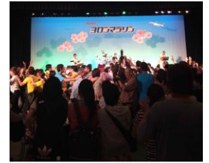
ウェルカムパーティの様様

たっぷり盛り上がり翌日はマラソン。厳しいコースですが島民総出の沿道からの応援は笑顔に溢れています。そして走り終わった後の完走パーティ。ウェルカムパーティも盛り上がりませんが、更に盛り上がり美味しいお酒を飲んでみんなで踊る。この完走パーティこそヨロンマラソンの楽しさの象徴だと思います。