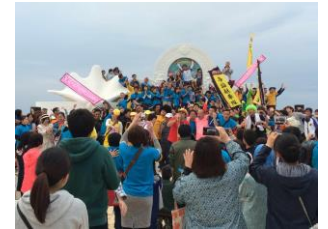
完走パーティの様様 (昨年の写真です)