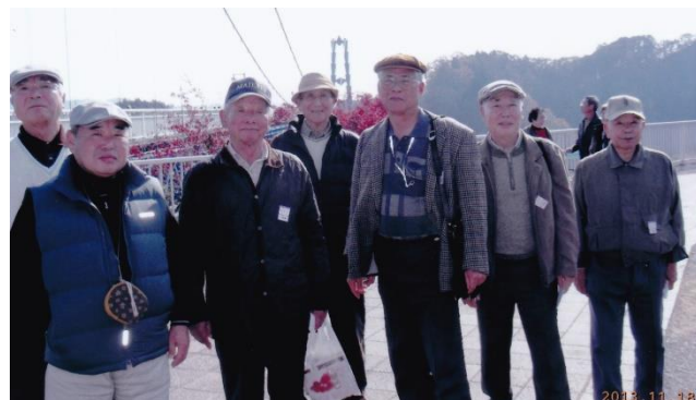
（史跡万歩会のバス旅行）

支部活動の基本は、本部よりの支援金と支部会員からいただく年会費をベースに運営をしているわけですが、年会費の納入者は年々減少。この 10 年の変化を見てみると、平成 17 年度納入者 184 名・平成 27 年度納入者 105 名で、平成 17 年度対比で 57%（約 4 割減少）となっているのが現状であります。会員の高齢化と若手の伸び悩みという現状を、指をくわえて眺めていても仕方ありません。どうしたら活性化を語り・活動を活発化できるのか永遠の課題とは思いますが他支部の活動も参考にし、又、ご指導ご支援なども得ながら、私どもの幹事の方々と力を合わせ改善の努力をしてゆく所存であります。